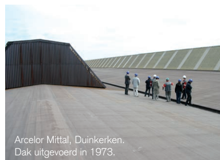
Arcelor Mittal, Duinkerken. Dak uitgevoerd in 1973.